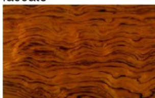
Bubinga Pommele Legno laccato