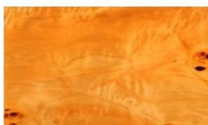
Mappa Burl Legno laccato

Finiture speciali sia in legno naturale che laccato o verniciature speciali sono ottenibili a richiesta con sovrapprezzo e comportano un considerevole allungamento dei tempi di attesa.