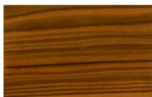
European Walnut Legno naturale