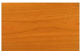
American Cherry Legno naturale o laccato