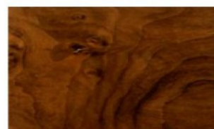
Walnut Cluster Legno laccato