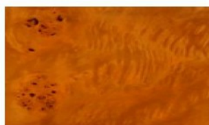
Papple Cluster Cognac Legno laccato