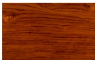
Bubinga Cognac Legno naturale o laccato