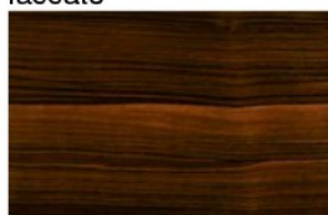
Macassar Legno naturale o laccato