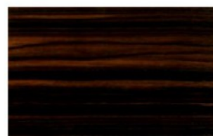
Macassar Ebony Legno naturale o laccato