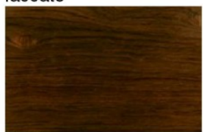
Bubinga Legno naturale o laccato