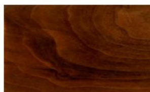
American Walnut Legno naturale o laccato